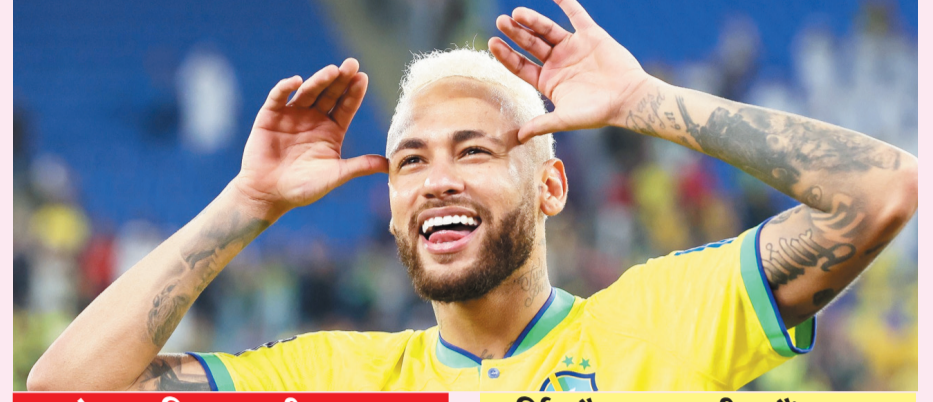
नेमार जूनियर (ब्राजील, 34)