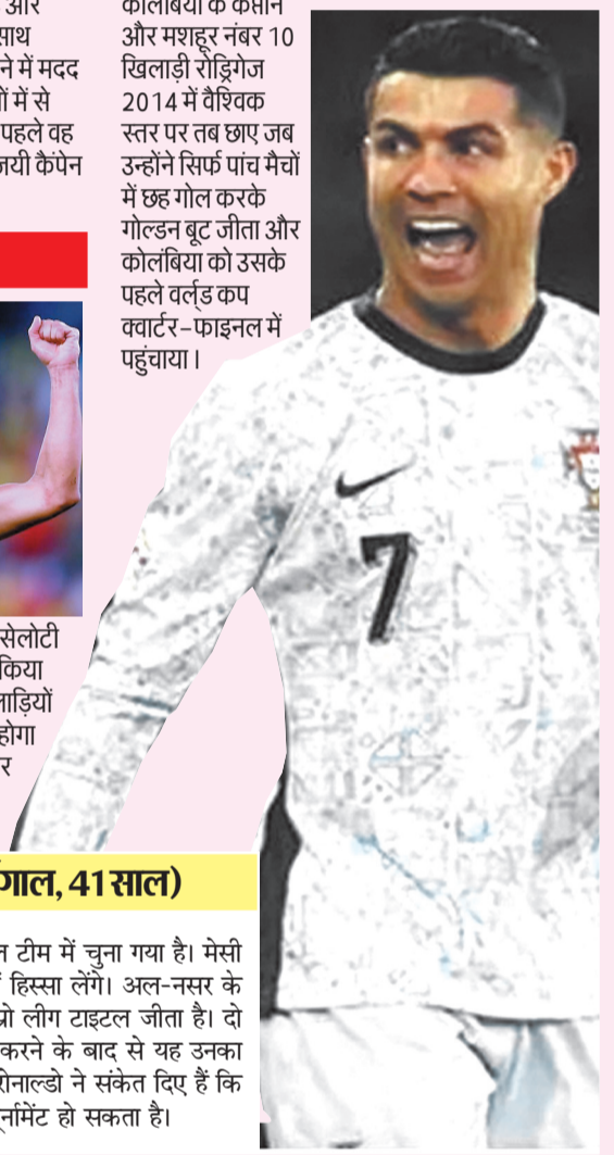
क्रिस्टियानो रोनाल्डो (पुर्तगाल, 41 साल)

मैनचेस्टर यूनाइटेड के मिडफील्डर को कार्लो एंसेलोटी की आखिरी 26 खिलाड़ियों की टीम में शामिल किया गया है और वह ब्राजील के सबसे असरदार खिलाड़ियों में से एक हैं। यह कासेमिरो का चौथा वर्ल्ड कप होगा और उम्मीद है कि यह उनके इंटरनेशनल करियर का आखिरी चेंपियन होगा।