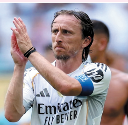
लुका मोड्रिक (क्रोएशिया, 40)

मिडफील्डर लुका मोड्रिक का यह पांचवां वर्ल्ड कप होगा। क्रोएशिया की वह आखिरी बार कप्तानी करते दिख सकते हैं। अर्जेंटीना के लिए खेलते हुए घरेलू मैच के दौरान गाल की हड्डी में फ्रैक्चर हो गया था, लेकिन उनकी सर्जरी सफल रही और वह एक प्रोटेक्टिव फेशियल मास्क पहनकर ट्रेनिंग पर लौट आए। क्रोएशिया के मैनेजर ज्लाटको डालिक ने फिर भी टीम में शामिल किया, जिससे टीम के लिए उनकी लगातार अहमियत का पता चलता है।